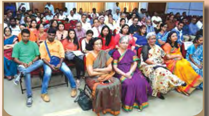
यशवंतराव चव्हाण प्रतिष्ठान, ठाणे जिल्हा केंद्र 'विचार कुंकू २०१८', उपस्थित जनसमुदाय