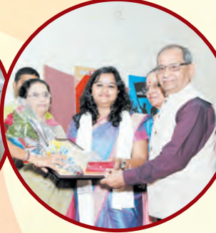
कृपाली विडये युवा सामाजिक पुरस्कार