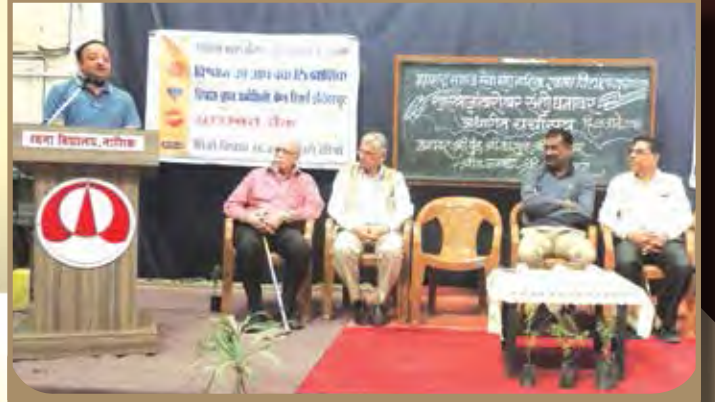
विभागीय केंद्र नाशिकच्या वतीने संशोधन पर्यटन कार्यशाळा घेण्यात आली होती.