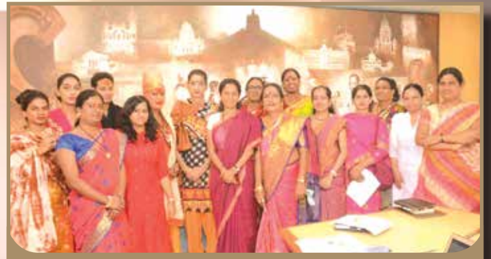
तृतीयपंथीय समुदायांच्या प्रमुख पदाधिकारी यांनी आपल्या विविध मागण्यांसाठी मा.खा.सुप्रिया सुळे यांची भेट घेऊन विविध विषयावर चर्चा केली.