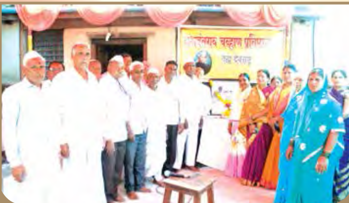
आधुनिक महाराष्ट्राचे शिल्पकार स्व. यशवंतराव चव्हाण यांचा ३३ वा स्मृतिदिन देवराष्ट्रे या त्यांच्या जन्मगावी साजरा करण्या आला.