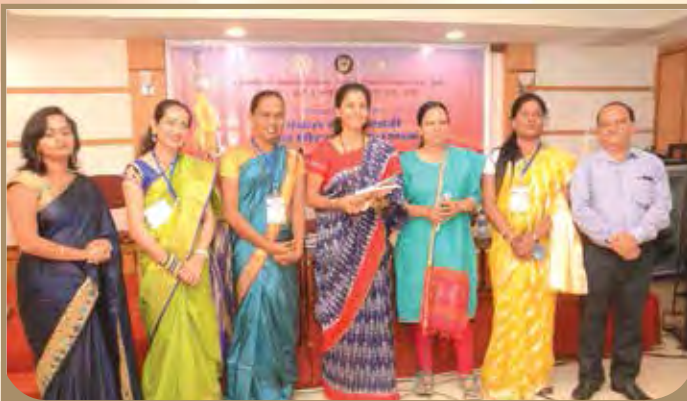
यशवंतराव चव्हाण प्रतिष्ठान, मुंबई, विकास अध्ययन केंद्र, कोरो आणि कम्युनिटी डेव्हलपमेंट ट्रस्ट यांच्या वतीने आयोजित 'एकल महिलांसाठी स्वतंत्र धोरणाची आवश्यकता' या विषयावर आयोजित राज्यस्तरीय चर्चासत्र