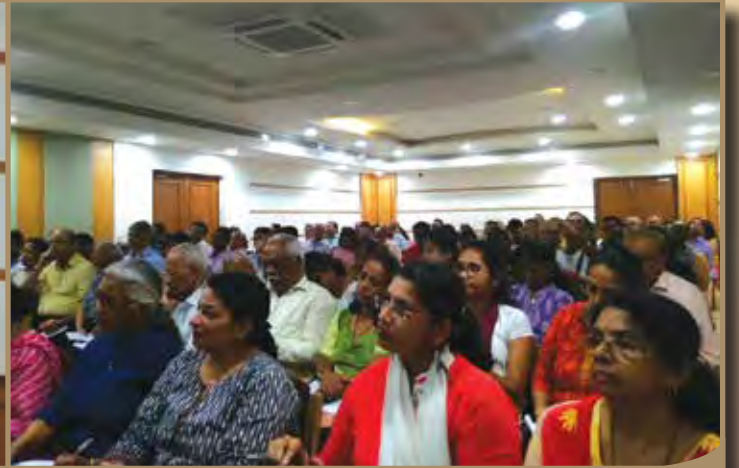
सहकारी गृहनिर्माण संस्था आयोजित बदललेले कायदे, नियम व जीएसटी विषयक मार्गदर्शन चर्चासत्र