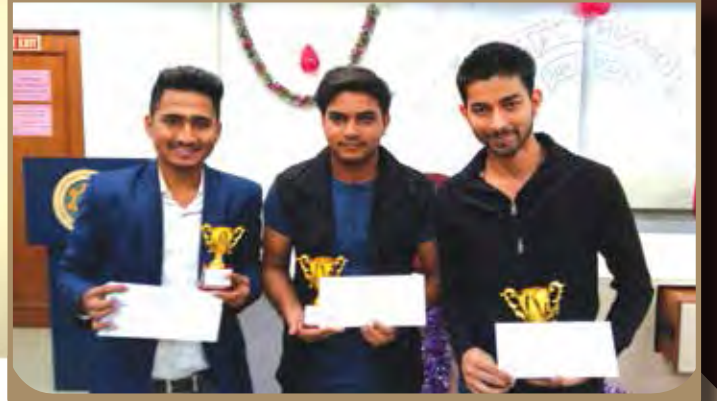
टॉपर्स ऑफ PG DAC 2017 बॅच