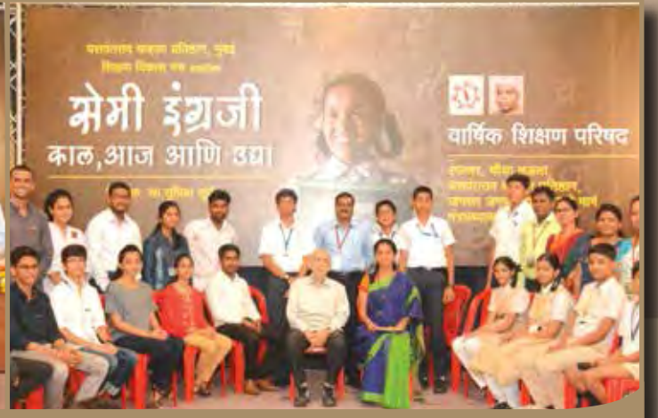
शिक्षण विकास मंच आयोजित 'सेमी-इंग्रजी' आज आणि उद्या या विषयावरील राज्यस्तरीय शिक्षण परिषद