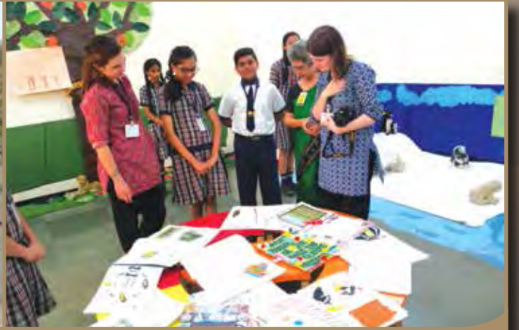
वसुंधरा पर्यावरण संवर्धन अभियान अंतर्गत शालेय विद्यार्थ्यांसोबत घेण्यात आलेले कार्यक्रम