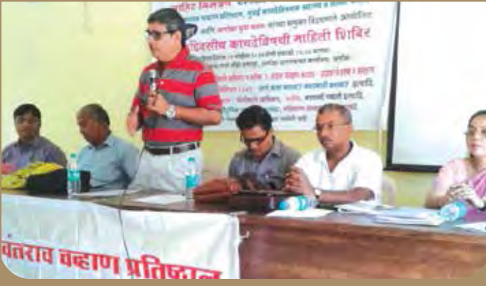
कायदेविषयक सहाय्य व सल्ला फोरम च्या वतीने सामाजिक कार्यकर्ते, युवक, युवती आणि महिला यांच्यासाठी 'एकदिवसीय कायदेविषयक माहिती शिबिर' आयोजित करण्यात आले होते.