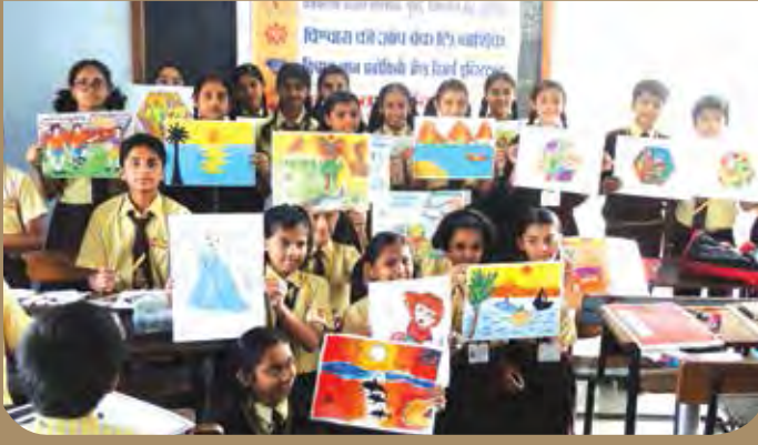
विभागीय केंद्र नाशिकच्या वतीने चित्रकला स्पर्धा घेण्यात आली होती.