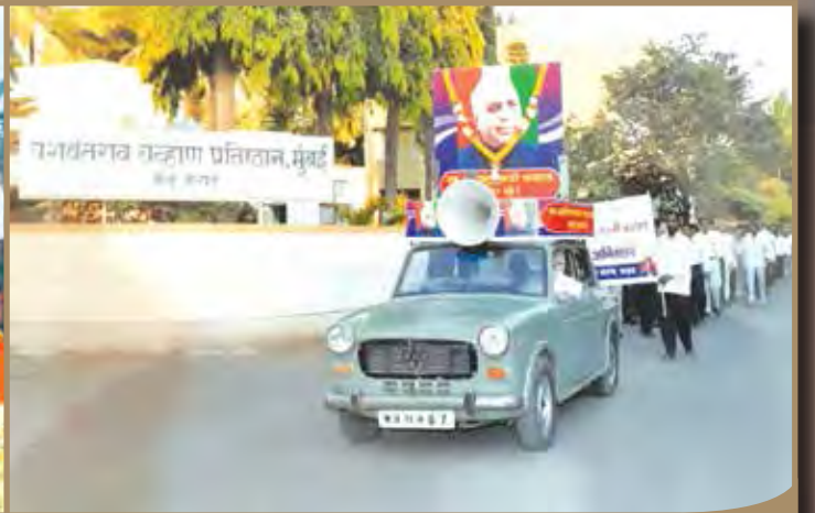
स्व. यशवंतराव चव्हाण यांची ३३वी पुण्यतिथी, विभागीय केंद्र, क-हाडच्या वतीने साजरी करण्यात आली.